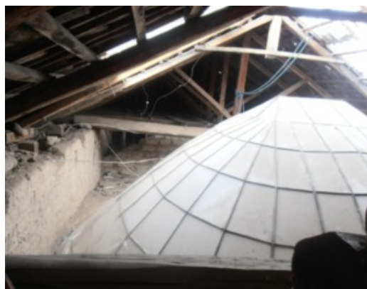
Figura 8: Intervención realizada en la cubierta de la Iglesia de San Luis

A su vez, en la nave principal de la iglesia, la cubierta fue intervenida con el fin de añadir una cúpula que ilumine el altar mayor. Para ello, se eliminaron elementos estructurales de la cubierta con el fin de dar paso a este domo interior, intervención que eliminó la continuidad estructural de la cubierta, convirtiéndose igualmente en un potencial riesgo ante solicitaciones de esfuerzos sísmicos. Además se convirtió en un elemento añadido que restó originalidad al bien patrimonial.