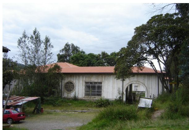
Figura 11: Casa de Hacienda 'San Vicente', cubierta original y pos-intervención. CASO 3: Edificación de arquitectura menor