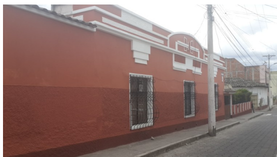
Figura 12: Casa patrimonial de arquitectura menor. Otavalo, Imbabura, Ecuador