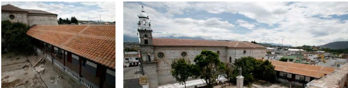
Figura 2: Iglesia de Santo Domingo de los Padres Dominicanos, Ibarra, Imbabura.

La construcción de la actual Iglesia de Santo Domingo de los Padres Dominicanos, con su respectivo convento, se inició en 1923 y se concluyó luego de medio siglo de trabajo, en el sitio donde desapareció el primer templo como consecuencia del terremoto de 1868. La falta de mantenimiento y recursos por parte de los custodios ocasionó deterioro de este bien patrimonial, que estuvo a punto de declararse en estado ‘ruinoso’. El Decreto de Emergencia de Patrimonio Cultural ejecutó trabajos de consolidación arquitectónica e impermeabilización de cubiertas crujías centrales. También hubo un rescate de estructuras y formas originales de la edificación y consolidación de obra muraria. De mucho interés son los trabajos de drenes y subdrenes, así como un sistema de evacuación de aguas lluvia y trabajos de mantenimiento.