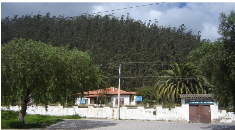
Figura 9: Casa de Hacienda ‘San Vicente’, Otavalo, Imbabura, Ecuador

Corresponde a una edificación de la tipología casas de hacienda, las mismas que se encuentran dispersas pero cercanas al centro histórico de la ciudad de Otavalo. La Casa de Hacienda ‘San Vicente’ se trata de una edificación patrimonial de los años 1930, construida con cimentación de piedra unida con mortero de cal y arena, muros portantes de adobe y tapial y cubierta de madera y teja. Esta edificación estuvo abandonada por unos 10 años y se generaron patologías como producto de daños en la cubierta principalmente, la humedad es otro factor que aportó en el deterioro de la edificación provocando daños en muros portantes y cimentaciones. Con estos antecedentes, el Municipio de Otavalo en coordinación con el Instituto Nacional de Patrimonio Cultural, realizó estudios y contrató la ejecución de la obra.