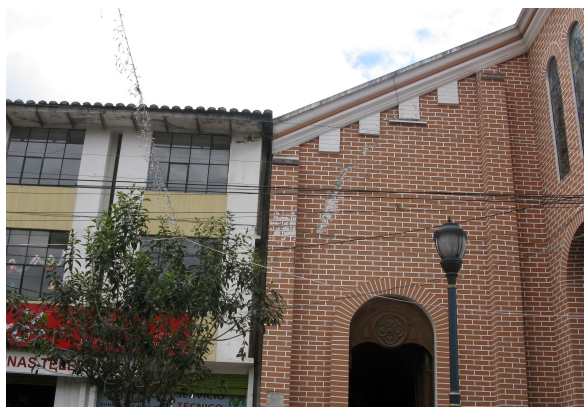
Figura 7: Adosamiento de construcción de hormigón armado a edificación patrimonial