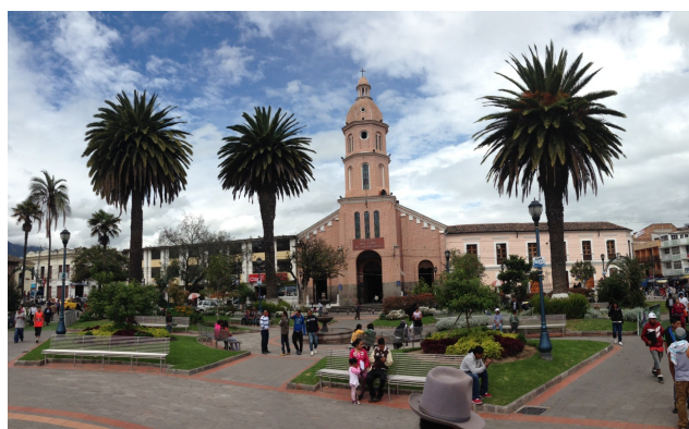
Figura 6: Iglesia de San Luis, Plaza Central de Otavalo, 2014.

Declarado Santuario Nacional, construido en la Ciudad de Otavalo, Provincia de Imbabura, Ecuador, de 1868 a 1893, posterior al terremoto de 1868, cuando Otavalo prácticamente desaparece sin dejar vestigios de edificaciones anteriores a este acontecimiento.