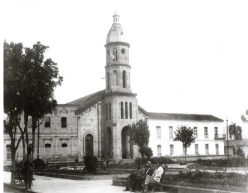
Figura 5: Iglesia de San Luis, 1930