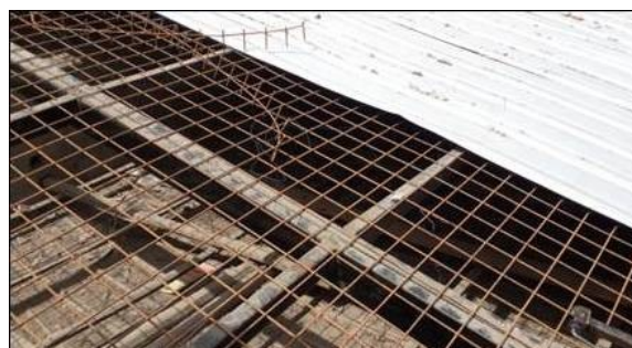
Figura 13: Intervención en cubierta de edificación patrimonial