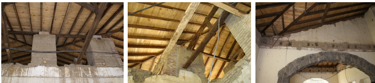
Figura 10: Casa de Hacienda 'San Vicente', intervención realizada en la cubierta.

Luego de la intervención en la cubierta, aumentaron los problemas debido a que no se respetó la configuración original y porque se generaron nuevos esfuerzos y solicitaciones estructurales a elementos que no estaban técnicamente contruidos para ello provocando el aparecimiento de nuevas fisuras y patologías que no existían antes de la intervención.