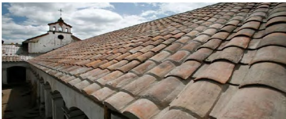
Figura 3: Antiguo Convento de las Carmelitas, Caranqui, Imbabura.